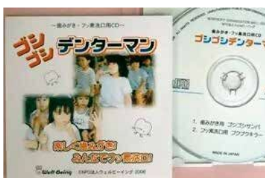
図5:音楽用CDの例(「ゴシゴシデンターマン」NPO法人ウェルビーイング)