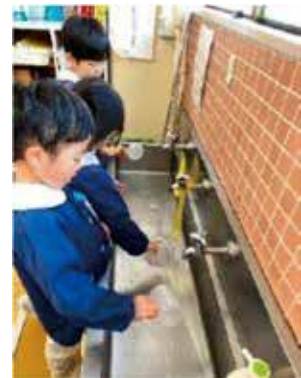
図8~10:実施の例