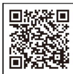
フッ化物洗口実践集2 (愛知県)