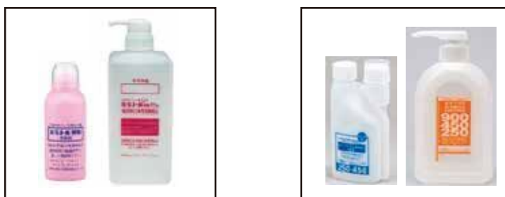
図4:溶解ボトルの例(左:ミラノール ® 用、右:オラブリス ® 用)