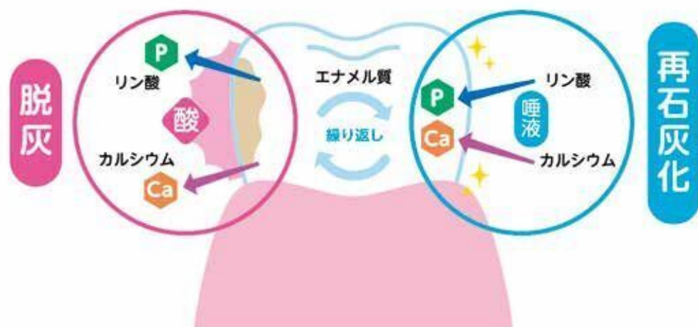
図1 脱灰と再石灰化

むし歯を予防するには、それぞれの要因に合わせた予防手段を組み合わせる実践することが大切です。