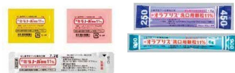
図3:フッ化物洗口剤商品の例