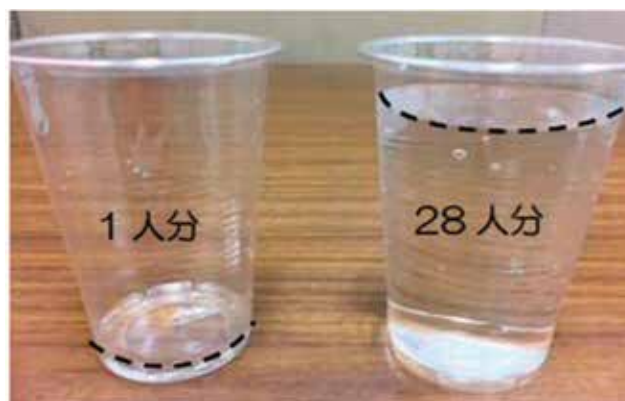
図12:1回使用量と不快症状が現れる可能性量の比較