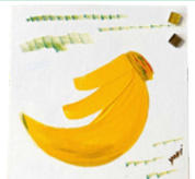
モザイクタイルアート