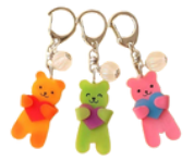
立体プラバン などが作れるよ!