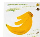
カスタムボールペン