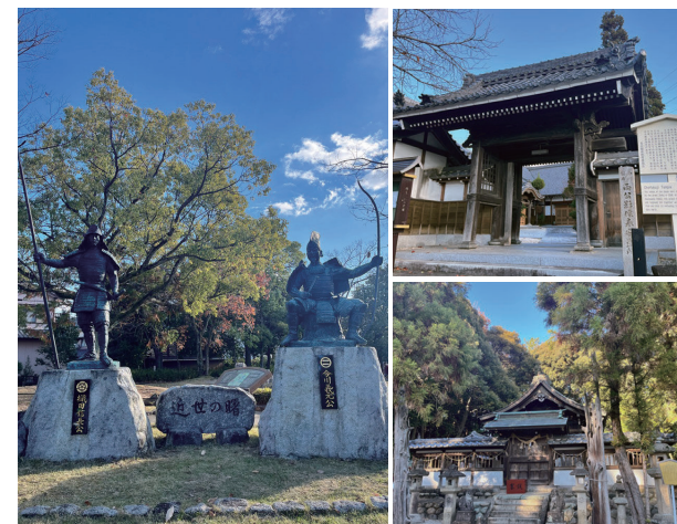
桶狭間古戦場公園の銅像