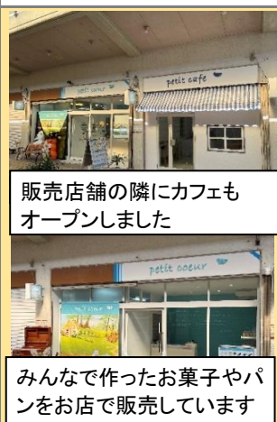
販売店舗の隣にカフェもオープンしました