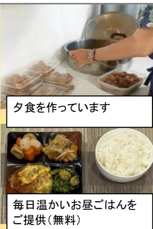
夕食を作っています