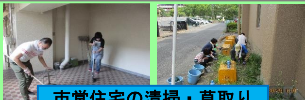
市営住宅の清掃・草取り