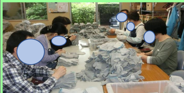
軍手の検品・仕分け作業（軽作業）