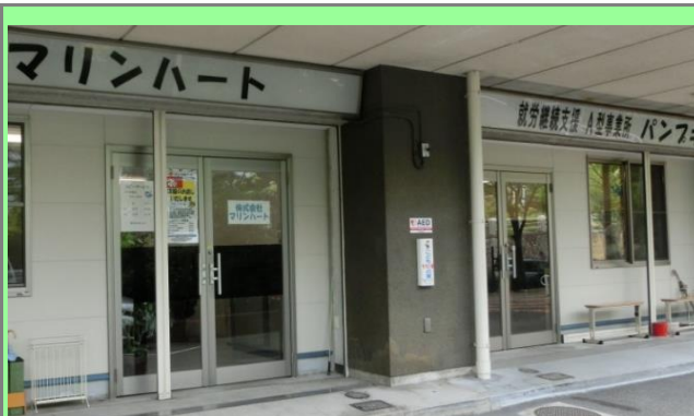
市営「新港栄荘1階店舗」