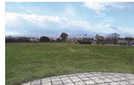
現在の滝の水公園

昭和6年、私立愛知高等薬学学校が開校し、私立名古屋薬学専門学校となった後、昭和26年名古屋市立大学薬学部として、瑞穂区へ移転しました。跡地は伊勢湾台風によるがれきが集積された後、公園として整備されました。