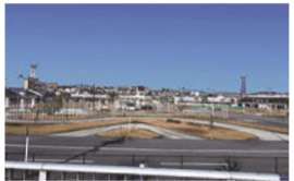
現在の名鉄自動車学校

鳴海球場は、昭和2年に愛知電気鉄道(現名古屋鉄道)により建設され、昭和33年に閉鎖されました。跡地には翌年、名鉄自動車学校が開校し、現在もスタンドなどが残っています。