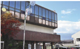
現在の緑生涯学習センター

鳴海宿は、東海道五十三次の40番目の宿場として栄えました。明治以降、この地には鳴海町役場や緑区役所の旧庁舎など、役場公所も置かれていました。鳴海町の建物は、現在、鳴海八幡宮の敷地内に移築されています。