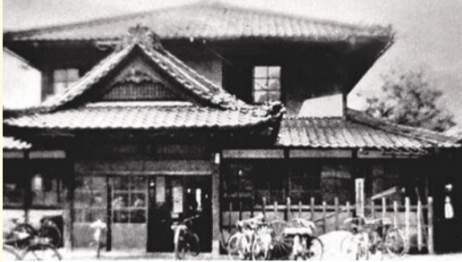
鳴海町役場旧庁舎

鳴海宿は、東海道五十三次の40番目の宿場として栄えました。明治以降、この地には鳴海町役場や緑区役所の旧庁舎など、役場公所も置かれていました。鳴海町の建物は、現在、鳴海八幡宮の敷地内に移築されています。