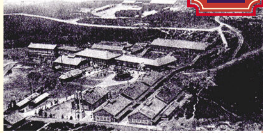
昭和初期の名古屋薬学専門学校