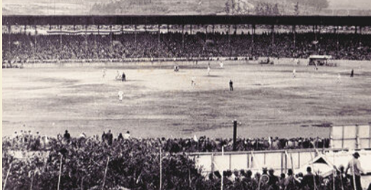
昭和11年 東京巨人軍VS名古屋金鯱軍の試合

鳴海球場は、昭和2年に愛知電気鉄道(現名古屋鉄道)により建設され、昭和33年に閉鎖されました。跡地には翌年、名鉄自動車学校が開校し、現在もスタンドなどが残っています。