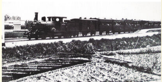
明治40年代の大高駅を通過するSL