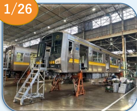
藤が丘工場（名東区）