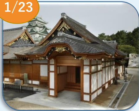
名古屋城本丸御殿（中区）