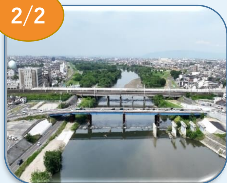
堀川・枇杷島橋など（中区など）