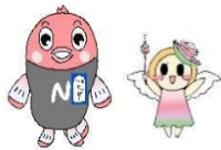
マスコットキャラクター ナッピー・ハボン