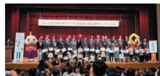
(防災めり絵コンテスト)