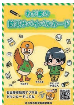
(防災サバイバルカード)