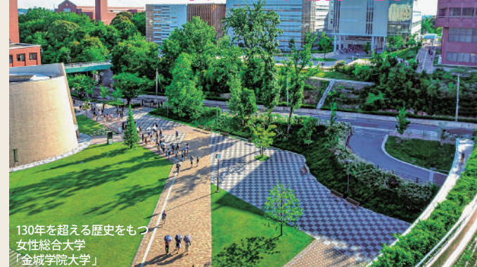
130年を超える歴史をもつ 女性総合大学 「金城学院大学」

区の西部は経済や区政の中心で、丘陵地の東部には豊かな自然が残っている。人・自然・科学が調和する「志段味ヒューマン・サイエンス・タウン」など新しい町づくりが進み、文教施設や福祉施設も多く、年々人口が増加中!