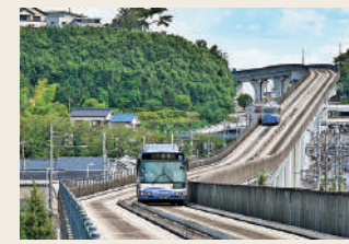
鉄道とバスの利点を合わせたゆとりーとライン(→P4)

名古屋市内で唯一地下鉄が通っていない区だが、名鉄瀬戸線、JR中央本線、ゆとりーとラインが走っており、交通は至便。東名高速道路・守山スマートICに加え、名古屋第二環状自動車道や国道19号も通り、車での移動も便利!