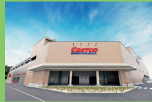
ガスステーションを併設している

高品質な優良ブランド商品ができる限り低価格で提供するアメリカ発祥の会員制倉庫型店。国内30カ所目、名古屋初の倉庫店として誕生! [DATA] ⑨守山区中志段味特定土地地区面整理組合地区内70街区1-1 ⑩ゆとりーとライン志段味交通広場バス停から徒歩5分 ⑪10~20時 ⑫無休 ⑬862台