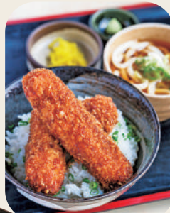
新で当地グルメも楽しめる(→P10)

名古屋名物の老舗や隠れた名店からおしゃれなカフェまで、ジャンル幅広く魅力的なお店が点在。農園も多く、新鮮な青果や良質な伏流水で醸す日本酒など、恵まれた環境を生かした特産品が楽しめるのも魅力。