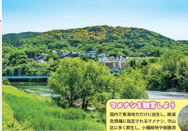
名古屋市の外周をめぐり伊勢湾に注ぐ庄内川