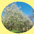
守山区中央部に広がる広大な小幡緑地(→P7)

国内で東海地方だけに自生し、絶滅危惧種に指定されるマメナシ。守山区に多く群生し、小幡緑地や御膳洞(ひぜんぼら)公園などで見られる。