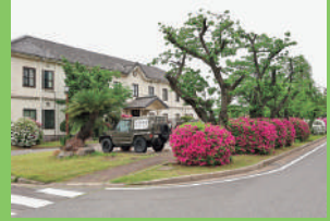
史料館は旧軍の歩兵第33連隊本部などに使われた建物を利用

[DATA] ⑨守山区守山3-12-1 ⑩名鉄瀬戸線守山自衛隊前駅から徒歩4分 ⑪史料館9~15時(要予約) ⑫土・日曜、祝日 ⑬なし