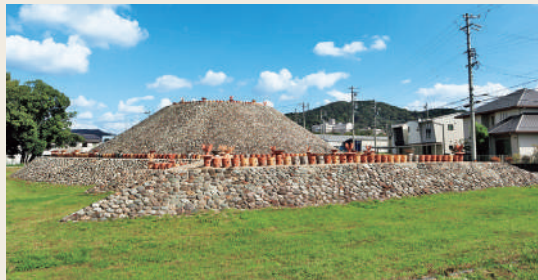
守山区には名古屋市で最多の古墳が(→P4)