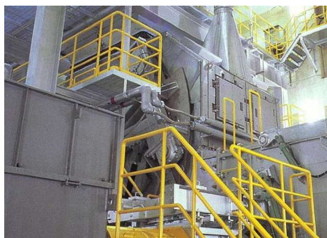
ごみを細かく砕く機械

まいにちだ 毎日出しているごみは、その後どうなるのでしょうか？ あんぜん かんきょう はいりょ しより しく まな 安全で環境に配慮した処理の仕組みを学んでみませんか み ぜひ見に来てね