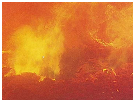
ごみを燃やしている様子