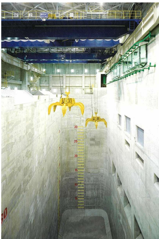
ごみピットとごみクレーン