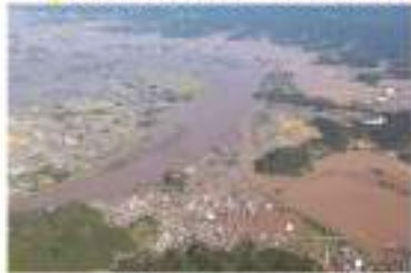
令和元年東日本台風で中小河川(内川・新川)が決壊し、浸水するようす

注意! 中小河川は水位が短時間で急激に上昇する場合がありますので、危険な時は早めの避難を!