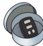
リレーアタック防止缶