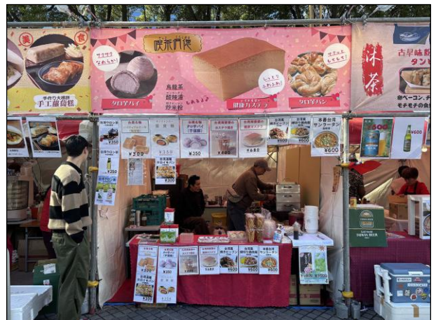
飲食ブース ⑳：喫茶們俣