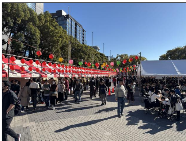
会場全体 会場内の様子 4