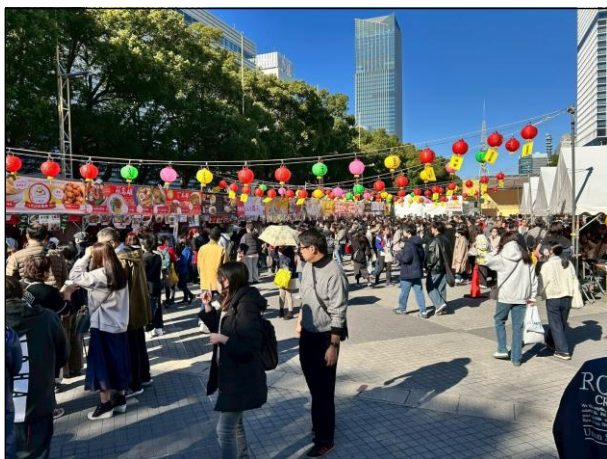
会場全体 会場内の様子 3