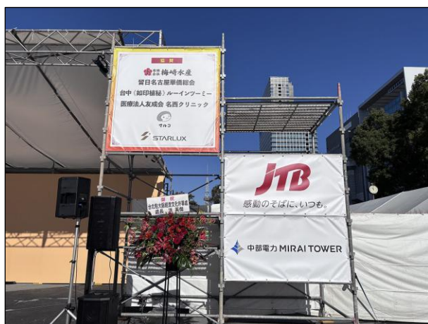
ステージ 看板（上手）