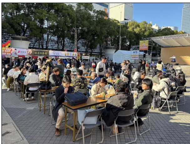
飲食ブース 飲食スペース (ステージ前)