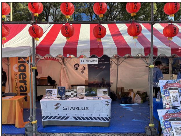
④③：スターラックス航空