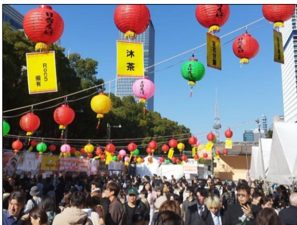
会場全体 会場内の様子 5