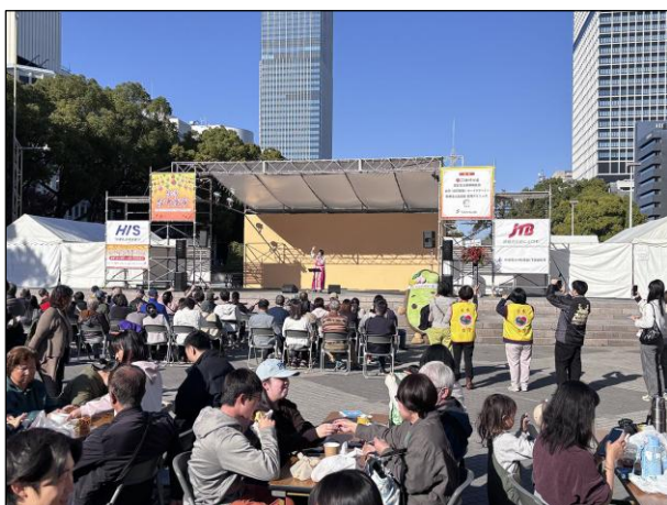
ステージ ステージ風景