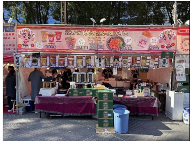
飲食ブース ⑰⑱：台湾屋台SARIKAKA