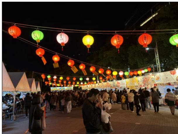
会場全体 会場内の様子9