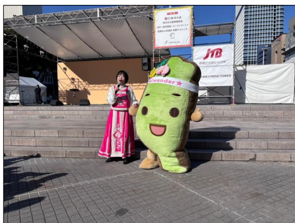
会場全体 タイワンダー グリーティング