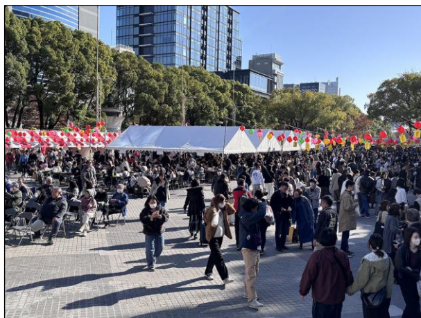
会場全体 会場内の様子 2