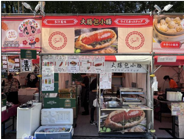
飲食ブース ⑬：つなとり