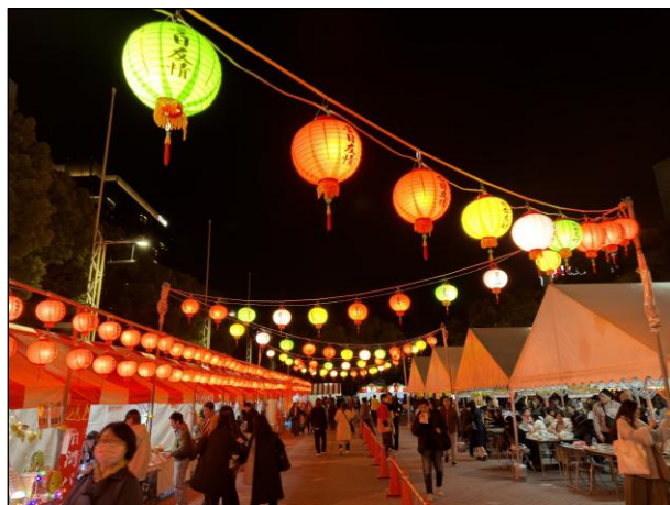
会場全体 会場内の様子7