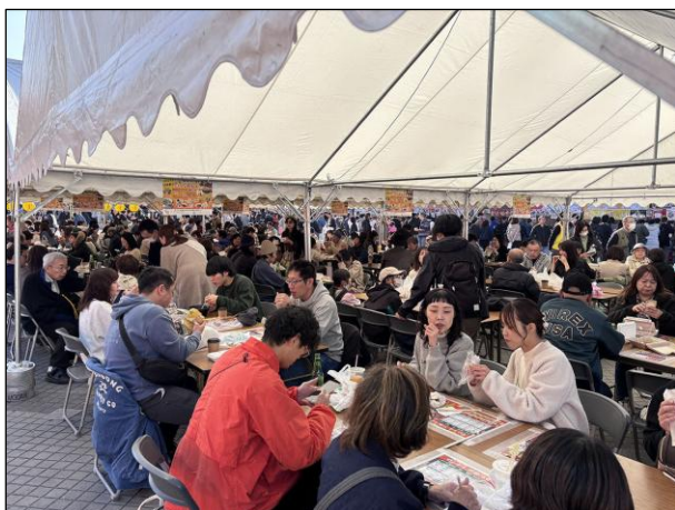
会場内の様子 飲食スペース (テント1)