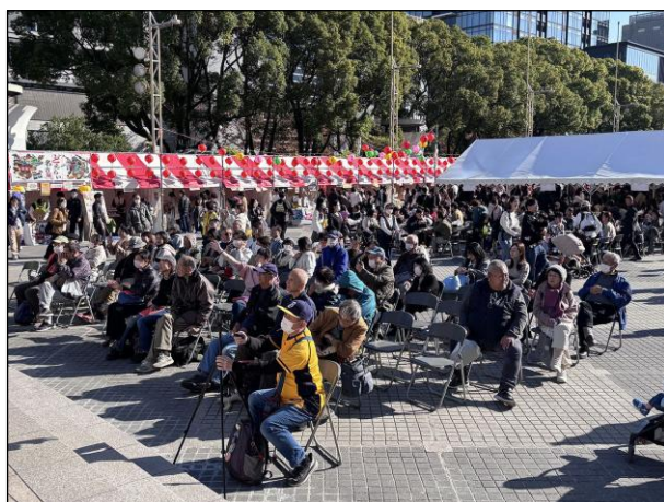
ステージ ステージ客席