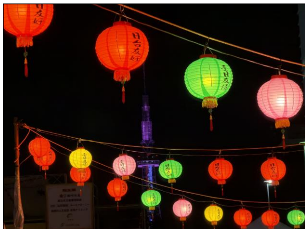
会場全体 会場内の様子8