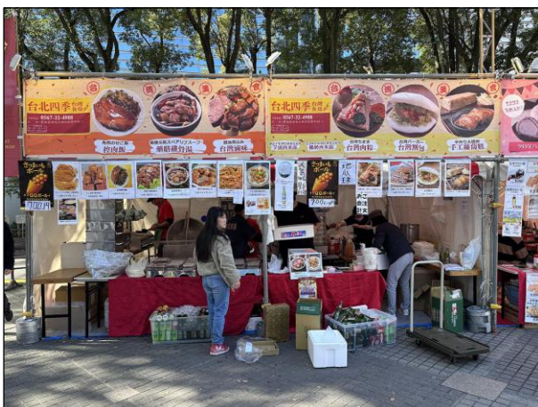
飲食ブース ㉑㉒：台北四季台湾食房