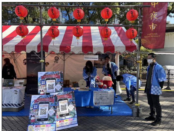
④④：中部国際空港利用促進協議会