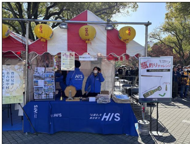
④⑧：株式会社 イチ・アイ・エス