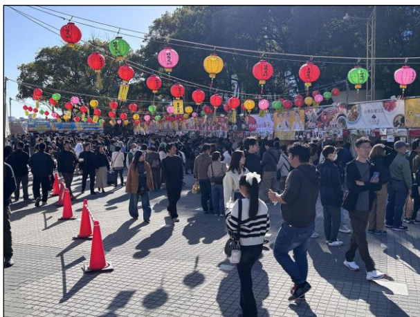
会場全体 会場内の様子 1