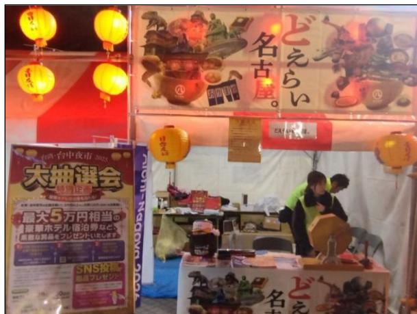
会場全体 会場内の様子11