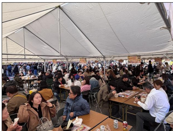
飲食ブース 飲食スペース (テント2)