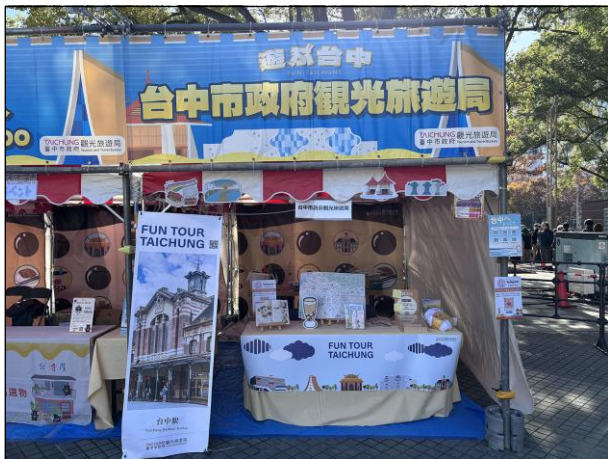
④⑤：台中市政府観光旅遊局