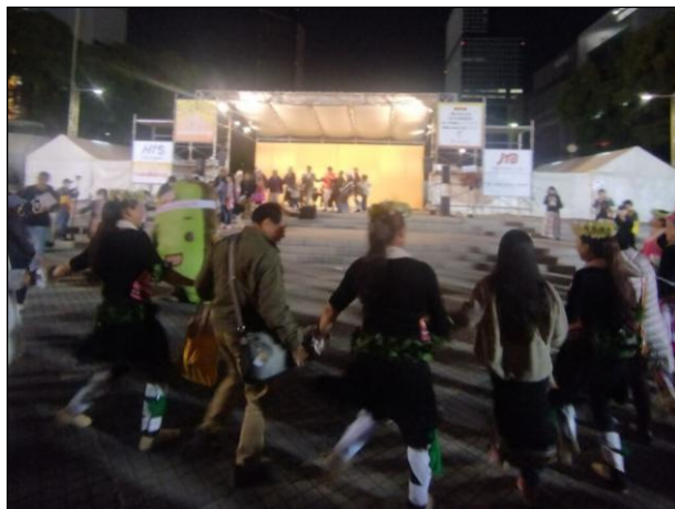
会場全体 会場内の様子10