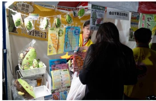
㉖台湾を応援する会