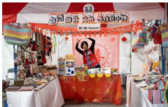
④2 想*創 Taiwan