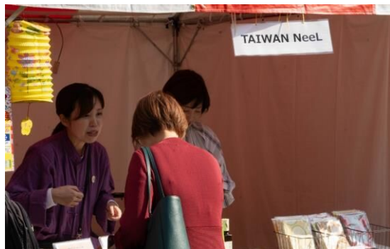
④0 TAIWAN NeelL