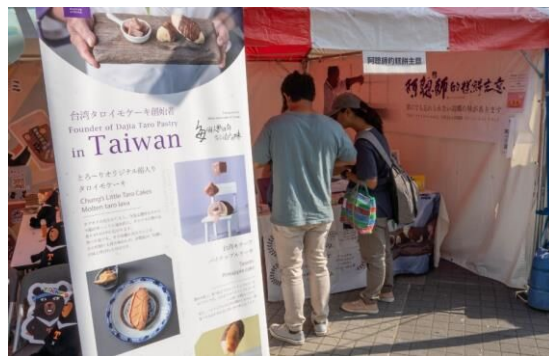
㉗阿聰師的糕餅主意