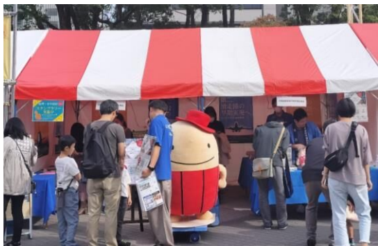
⑳・㉑中部国際空港利用促進協議会