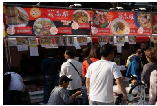
⑦・⑧ 台湾料理 高雄