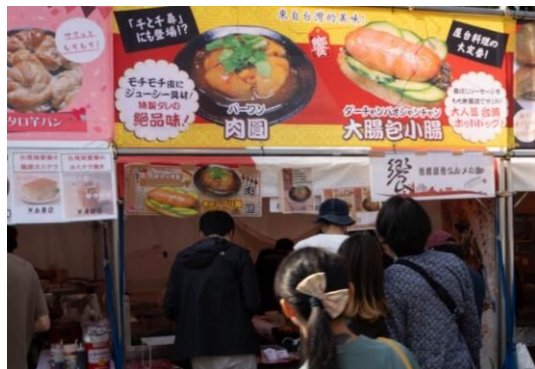
⑨ 饗 (Syan) 台湾屋台グルメの旅