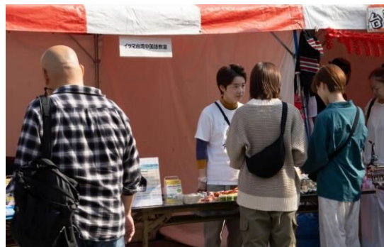
④1 イツマ台湾中国語教室