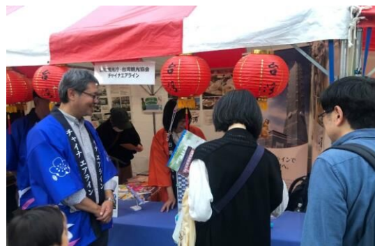
㉔台湾観光庁・チャイナエアライン