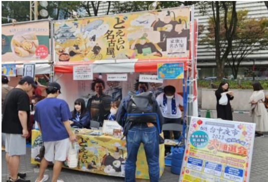
① イベント本部・どえらい名古屋。