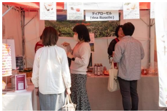
㉕ディアローゼル (dea Roselle)