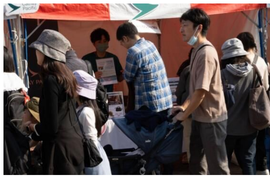
㉒キャセイパシフィック航空