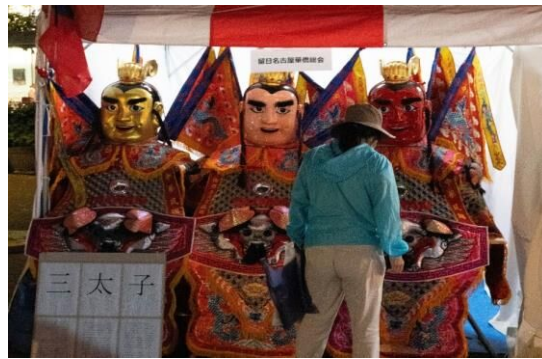
㉓留日名古屋華僑総会