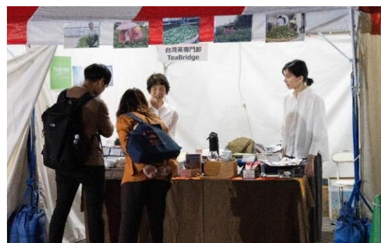
④4 台湾茶專門卸 TeaBridge