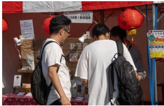
㉘食べるお茶！客家擂茶