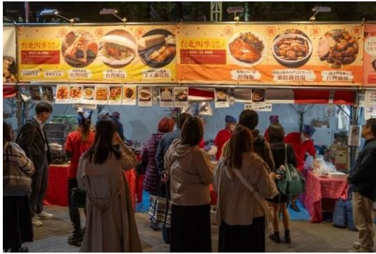
⑪・⑫台北四季台湾食房