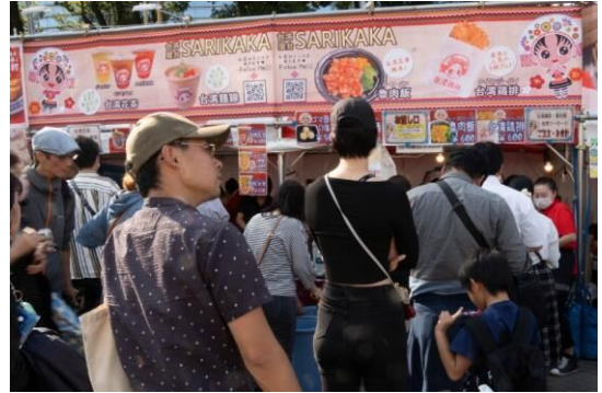
⑮・⑯台湾屋台 サリカカ