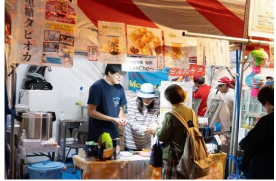
⑱本格台湾茶 藍鵲 ~LanChe~