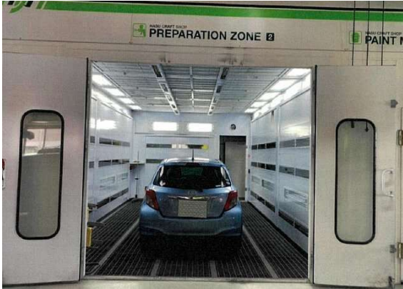
ご利用例：自動車塗装ブース（公害防止対策）