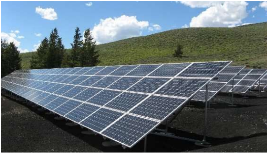
ご利用例：太陽光発電設備の設置