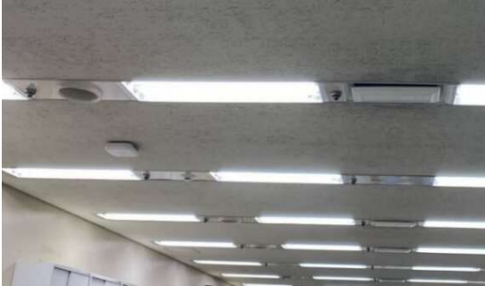
ご利用例：LED 照明への入替