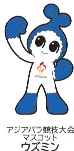
アジアパラ競技大会 マスコット ウズミン

問合せ 港区障害者基幹相談支援センター TEL 653-2801 FAX 651-7477