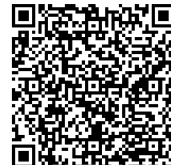
地域子ども会運営助成金に係る オンライン申請のご案内