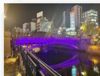
＜スポーツ市民局・子ども青少年局作成＞