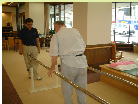
通所リハビリテーション

介護保険制度は、介護を必要とする方の状況や家族の希望に応じて保健・医療・福祉のサービスを総合的に提供し、老後の不安要因の1つである介護の問題を社会全体で支えることを目的としています。