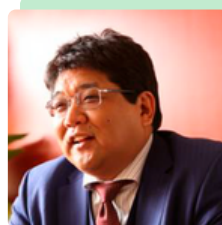
アドバイザリー株式会社 代表取締役