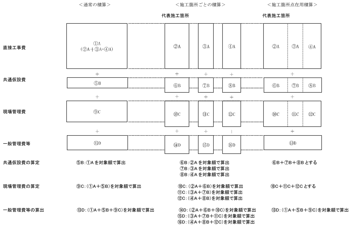
図2-1 施工箇所が点在する場合の積算イメージ

なお、一般管理費算出時の、共通仮設費率及び現場管理費率にかかる、施工地域を考慮した補正等は、「代表施工箇所」で設定した係数によるものとする。