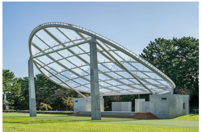
日光の明るさを活かした大屋根の設計 天王川公園