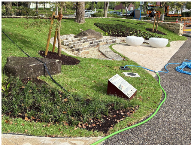
雨庭の設計 名城公園