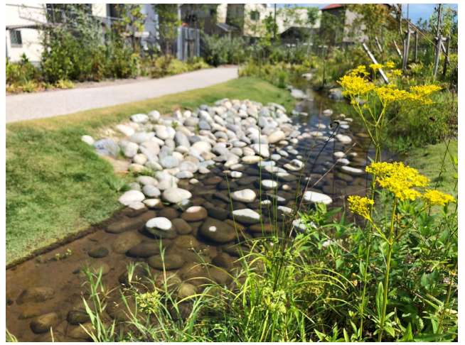
ビオトープの設計 稲沢市内民間緑地

超軽量+国産タマリユウ+植物に優しい人工培地 ESG時代の自然共生型屋上緑化システム