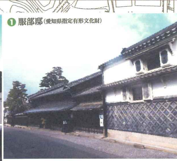
1 服部邸(愛知県指定有形文化財)