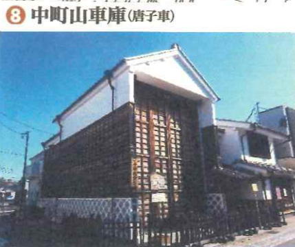
8 中町山車庫(唐子車)