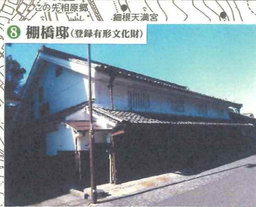
8 棚橋邸(登録有形文化財)