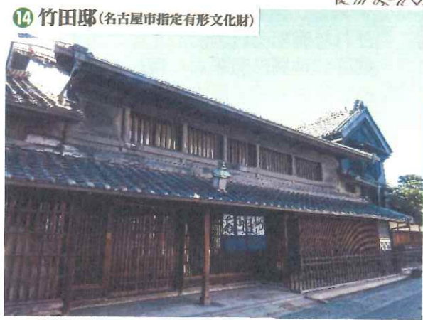
14 竹田邸(名古屋市指定有形文化財)