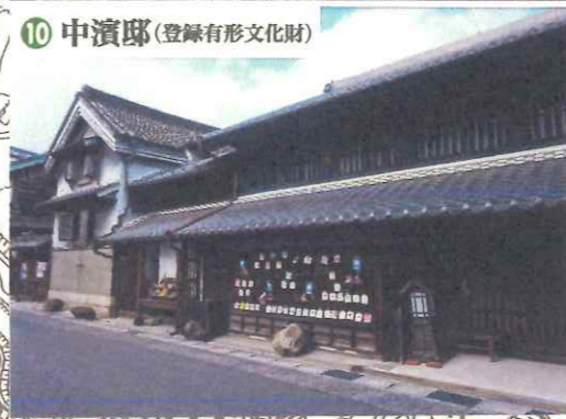
10 中濱邸(登録有形文化財)