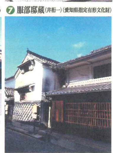
7 服部邸蔵(井桁一)(愛知県指定有形文化財)