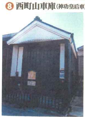
8 西町山車庫(神功皇后車)