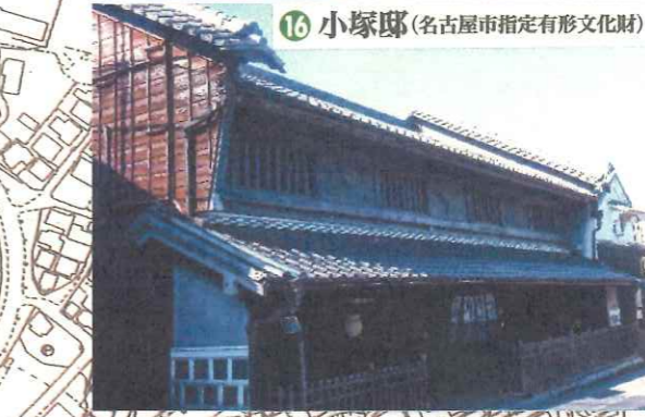
16 小塚邸(名古屋市指定有形文化財)