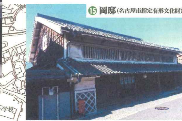
15 岡邸(名古屋市指定有形文化財)