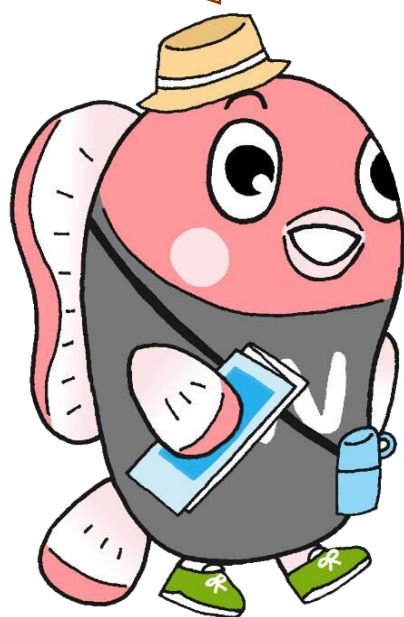
中川区マスコットキャラクター ナッピー