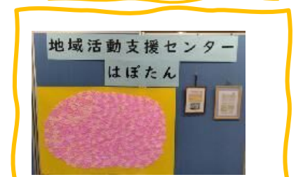
地域活動支援センターはばたん