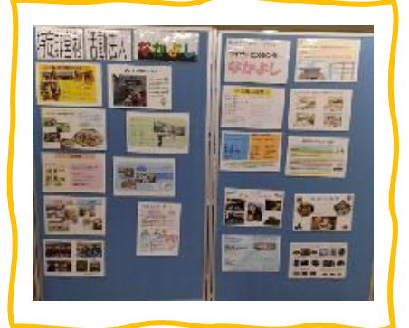
特定非営利活動法人 なかよし