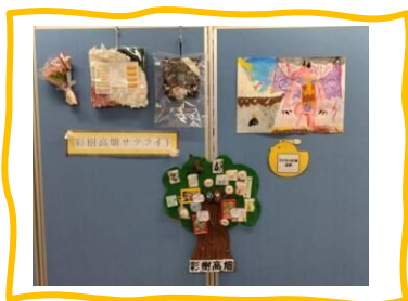
彩樹高畑 サテライト