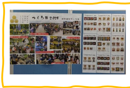
ぽかぽかワークス