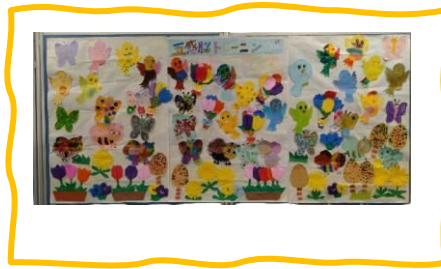
五感脳トレーニング