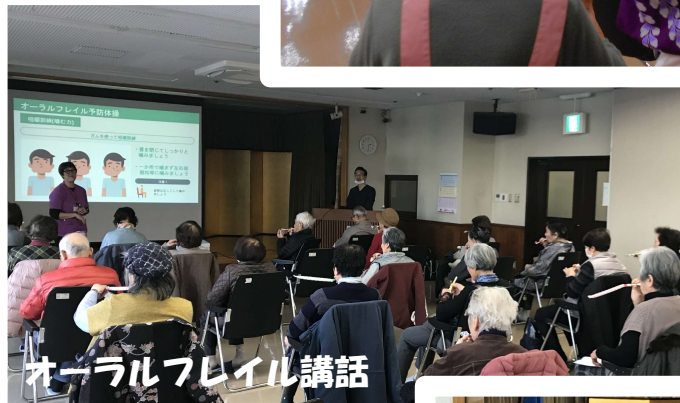
オールラブレイル講話