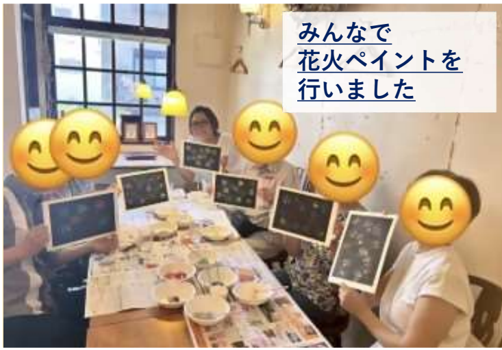
みんなで 花火ペイントを 行いました