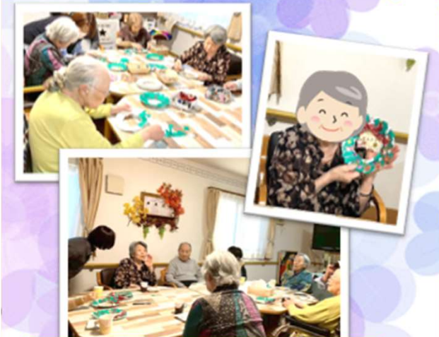
クリスマスリース作り