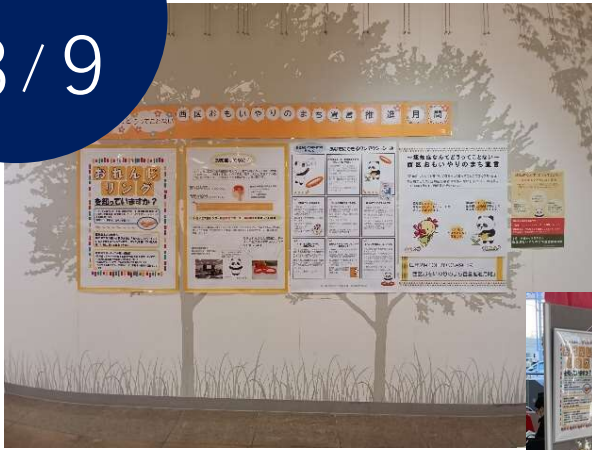
▲イオンタウン名西