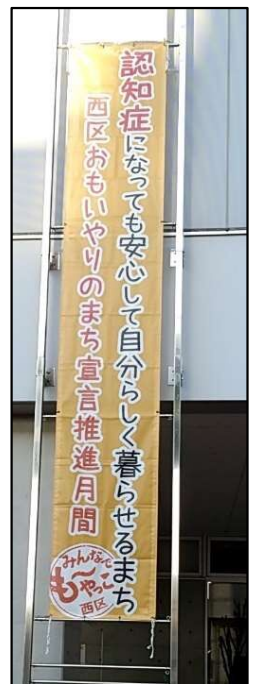
▲西区役所の懸垂幕