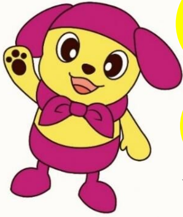
楠地区マスコットキャラクター くすのっち