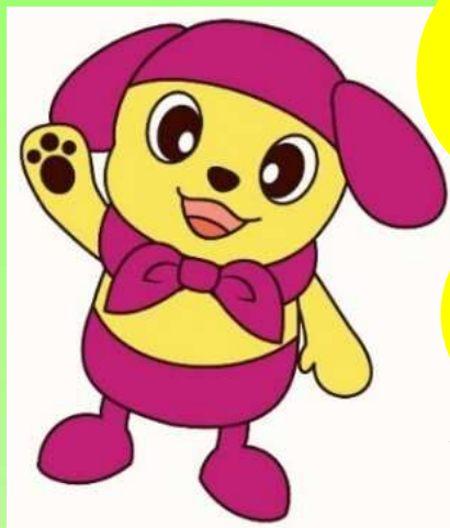
楠地区マスコットキャラクター くすのっち