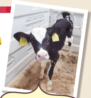
「エール」です。10月に産まれました!