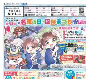
広報なごや名東区版