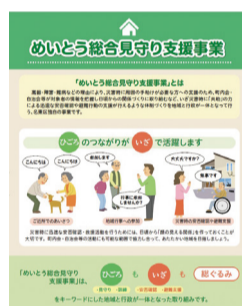
めいとう総合見守り支援事業