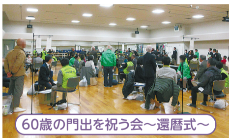
60歳の門出を祝う会～還暦式～