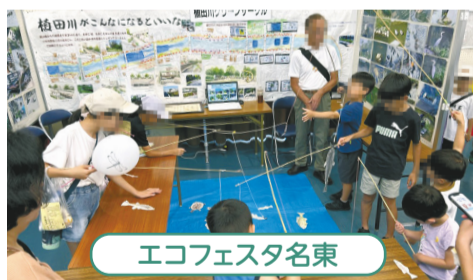
エコフェスタ名東