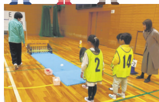
ビーンボウリング大会