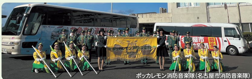
ポッカレモン消防音楽隊(名古屋市消防音楽隊)