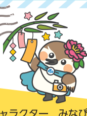
港区広報キャラクター みなぴい