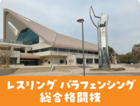
レスリング パラフェンシング 総合格闘技