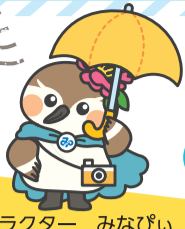
港区広報キャラクター みなぴい