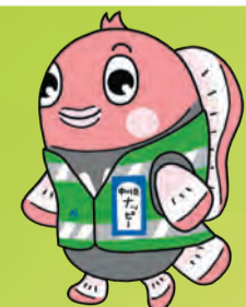
中川区マスコットキャラクター ナッピー