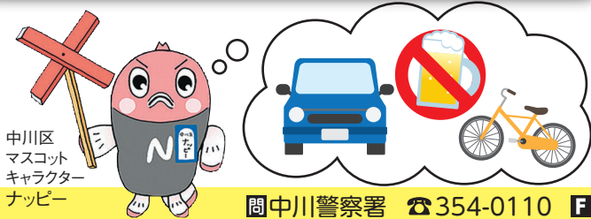
中川区 マスコット キャラクター ナッピー

問中川警察署 ☎ 354-0110 ☎ 354-1855 区役所地域力推進課 ☎ 363-4320 ☎ 363-4316