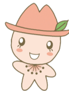
瑞穂区マスコットキャラクター みずほっぺ