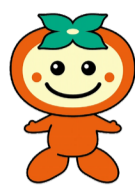
瑞穂市マスコットキャラクター かきりん

ともに「瑞穂」という名称を持つことをきっかけに始まった交流を推進し、両市・区の更なる発展を図るため、3/15(日)に友好交流協定を締結しました。また、瑞穂区を更に活性化していくため、区内のどまつりチーム「AAA瑞穂」を瑞穂区盛りアゲ大使に委嘱しました。