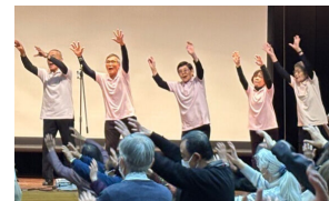
▲健康ささえ隊の活動の様子