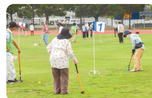
グラウンド・ゴルフ大会