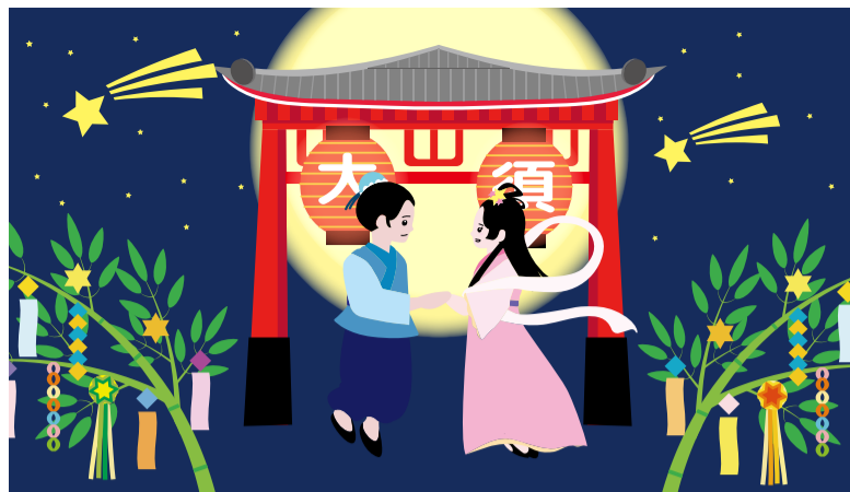
イラスト:広告デザイン専門学校 齋藤早羅 (令和6年度 中区ワークショップ区長賞受賞作品)

編集：中区役所 〒460-8447 栄四丁目1番8号 代表 ☎241-3601 FAX261-0535