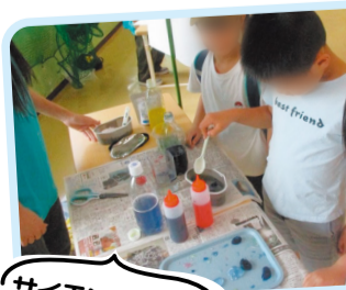
サイエンス屋台を体験しよう!