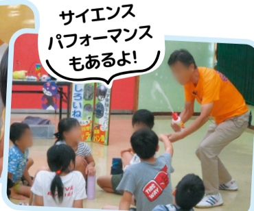
サイエンスパフォーマンスもあるよ!