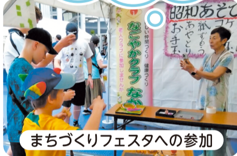
まちづくりフェスタへの参加