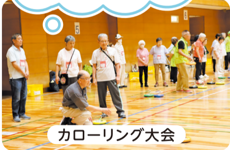
カローリング大会