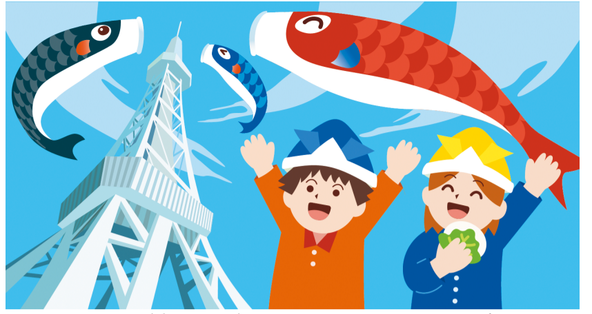
イラスト：専門学校名古屋デザイナー・アカデミー 楠田 彩乃 (令和7年度 中区ワークショップ区長賞受賞作品)

編集：中区役所 〒460-8447 栄四丁目1番8号 代表 ☎241-3601 FAX261-0535