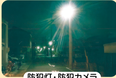
防犯灯・防犯カメラ