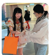
街頭 キャンペーン

毎年5月と11月を中心に広報・啓発を実施したり、虐待予防のための講座や研修会を開催しています。