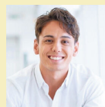
タレント ヴィトル

問合せ 区役所地域力推進課 ☎265-2223 FAX261-0535 ✉a2652221@naka.city.nagoya.lg.jp