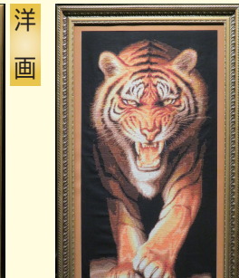
『刺繍 ー 虎』