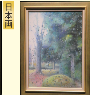
『日常と無常 ～しずく～』