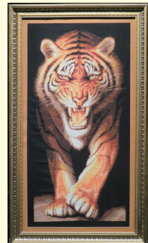
『刺繍 ー 虎ー』