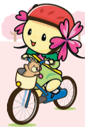
西区キャラクター 「ぶりむらん」

春は、新生活が始まり、交通量が増えるとともに、不慣れた環境で通学・通勤が始まることで、急な飛び出しなどによる事故が増える傾向があります。 一人一人が交通安全意識を高め、改めて交通ルールを見直しましょう。