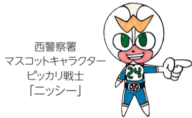
西警察署 マスコットキャラクター ピッカリ戦士 「ニッシー」

※比較的軽微な交通違反に交通反則告知書(青切符)が交付され、違反者が反則金を納付すれば、刑事罰に課されない制度 (16歳以上が対象)