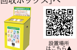
設置場所は こちら▲